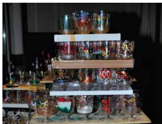
A bölcshódás, az óvodás gyerekek és az iskola diákjai 800 db poharat díszítettek az alkalomra