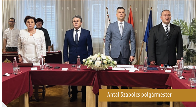
Antal Szabolcs polgármester

Megtartottuk önkormányzatunk ünnepélyes alakuló képviselő-testületi ülését hivatalunk Nagytanács-termében október 9-én, melyet megtisztelt Tasó László országgyűlési képviselő úr is.