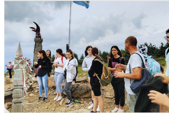
„Néphagyományaink, történelmi és kulturális emlékeink nyomában Székelyföldön”

„Megvalósult Magyarország Kormányának támogatásával” HAT-KP-1-2024/1-001659, és a HAT-KP-1-2024/1-001660 II. Rákóczi Ferenc Általános Iskola, Gimnázium, Szakképző Iskola, Alapfokú Művészeti Iskola és Óvoda, Hajdúsámson