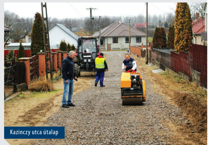
Kazinczy utca útalap